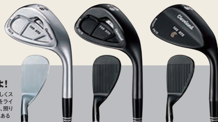
588 RTX CB クロム

溝の形状はそのままに、さらにやさしくスピニングがかけられるキャビティタイプをラインナップ。太陽が高いこの季節でも、照り返しが気にならない黒染め仕上げもある